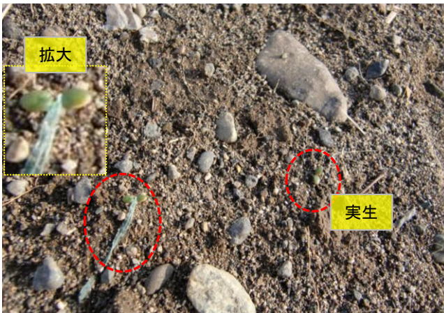
4/13(金)第2圃場に待望の発芽が始まりました。ゴミの間に芽を出した元気者もあります。