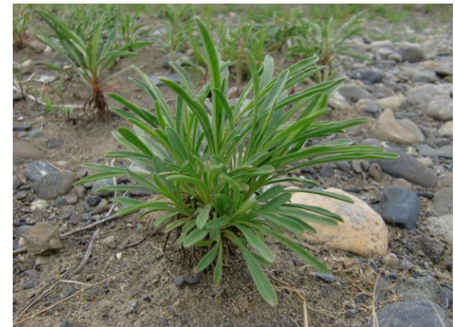
4/21(土)第1圃場のロゼットは葉が青々として光を一杯に浴びて成長しています。