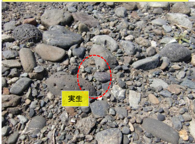
4/5(水)第1圃場で発芽が始まりました。埋まった玉石の間から芽が覗いています。