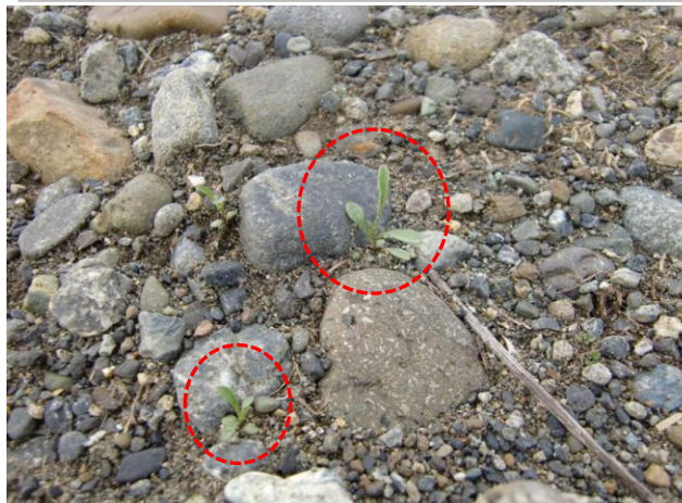
4/15(日)第1圃場の実生は早くも葉を大きく伸ばし始めました。(これらは第1圃場の2世です)