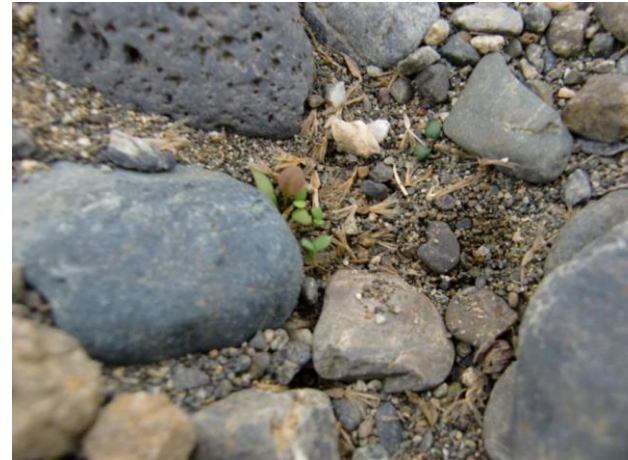
4/21(土)第2圃場のあちらこちらで玉石の間から発芽がした実生が見えます。