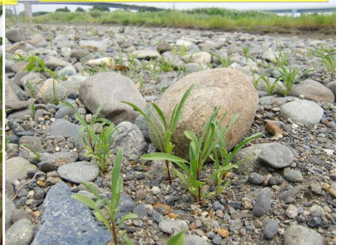
7月13日 第3圃場のロゼット 玉石河原のロゼットは生き生きしている。