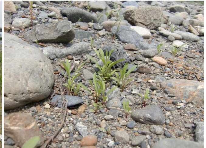
7月2日 第3圃場のロゼット 5月に発芽したロゼットも元気に成長！