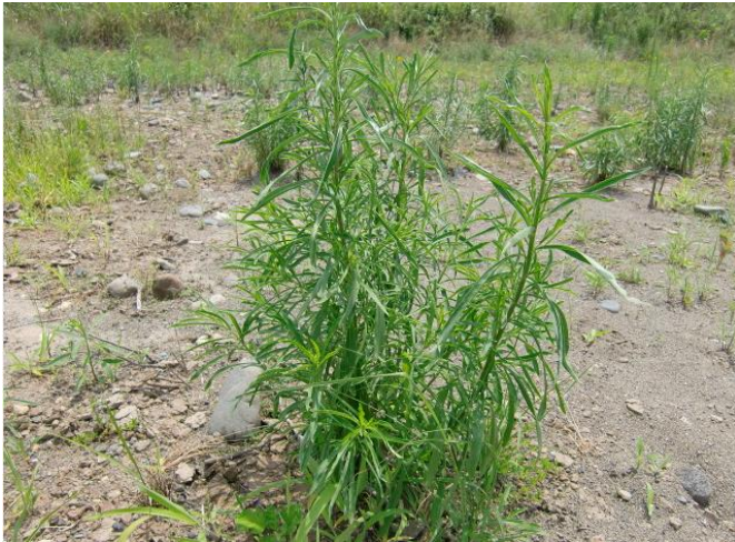
7月2日 第1圃場のロゼット 梅雨後半、青々と成長しています。

7月6日(土)例年よりも早めに梅雨明け宣言。その後も時々恵みの雨を齎し、圃場のロゼットや遅くに発芽した実生も順調に成長してきました。 猛暑日が続いた後の圃場を観察すると、シルトが玉石を覆い尽くした第1・2圃場は乾燥してロゼットが瀕死状態、玉石河原に近い第3圃場は生き生き。