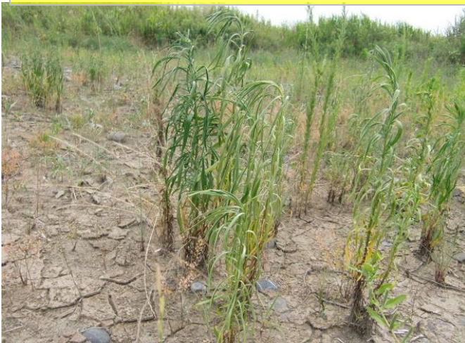
7月13日 第1圃場のロゼット 梅雨明け直後、猛暑日が続き萎れてきた。