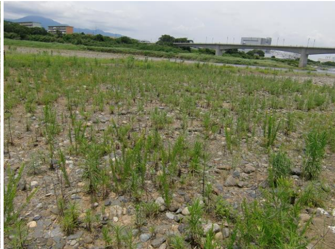
7月2日 第2圃場のロゼット 圃場一面にロゼットが見られます。