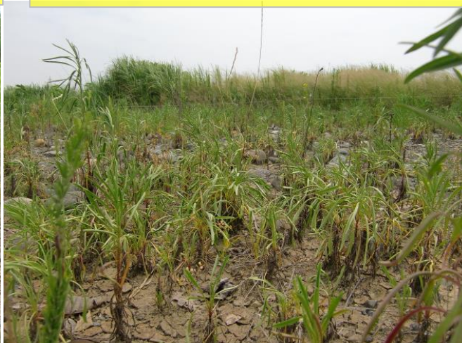
7月13日 第2圃場のロゼット シルトが乾燥し、今年発芽したロゼットは萎れが大きい。